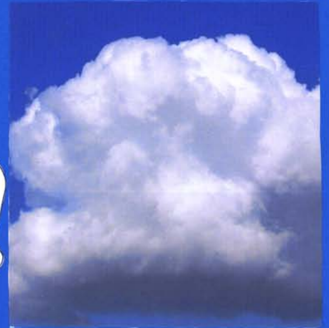
A água na atmosfera - névoa

Vista do espaço, a Terra é um planeta azul porque cerca de 71% da sua superfície está coberta por água. Na Terra, a água encontra-se nos três estados da natureza: sólido, líquido e gasoso.