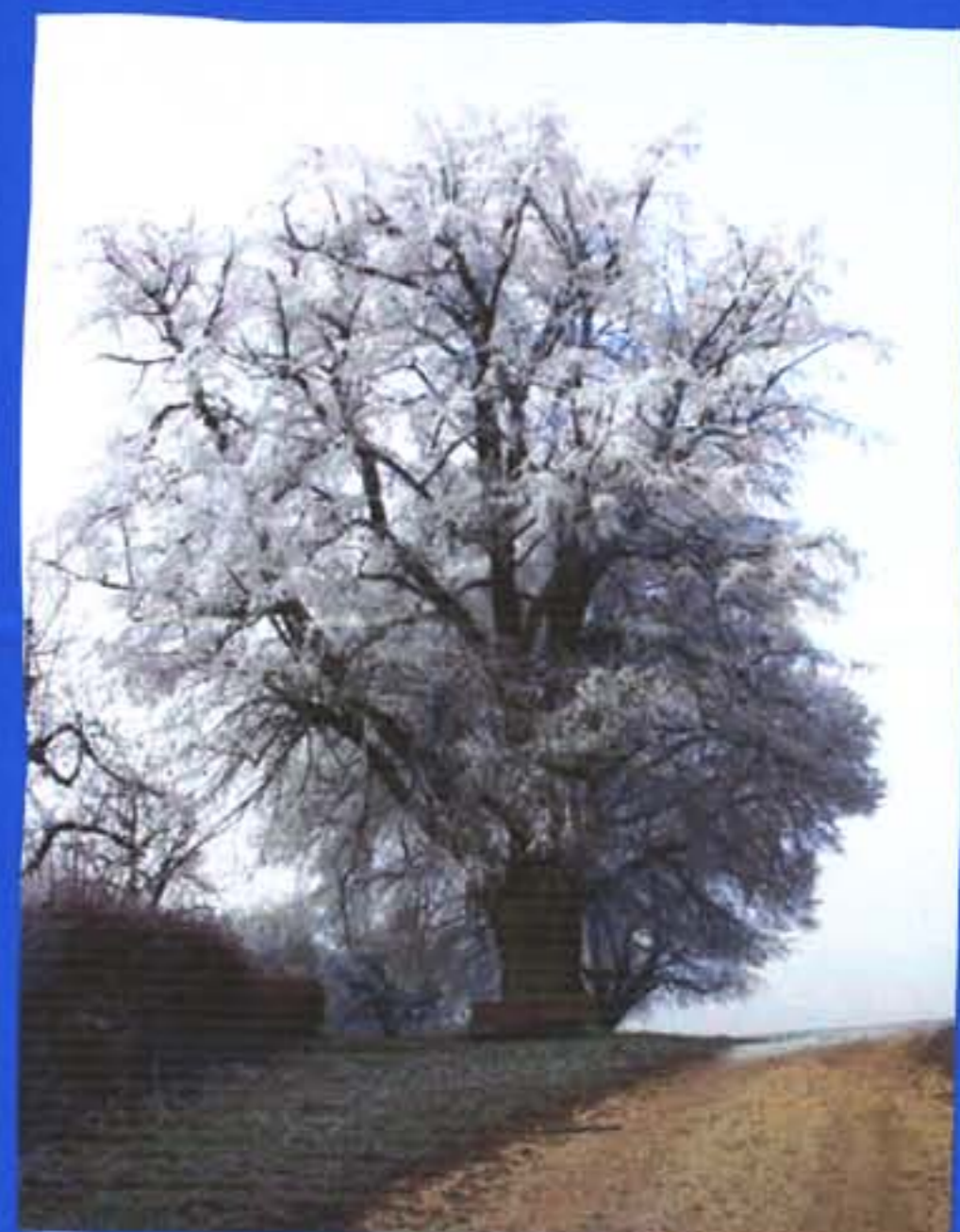
gelo cobrindo uma planta

A maior parte da água que cobre a terra encontra-se nos oceanos, nos lagos e nos rios, mas há uma quantidade considerável retida nos gelos das regiões polares, no subsolo e na atmosfera. Quando a água se encontra no estado gasoso não nos apercebemos dela porque não é visível. Nem toda a água, porém, se encontra livre, visto que faz parte do solo, das plantas e dos animais. Apesar da maior superfície da terra ser coberta por água, apenas se pode dispor de uma pequena porção dessa água porque grande parte dela não possui as propriedades necessárias à sua utilização.