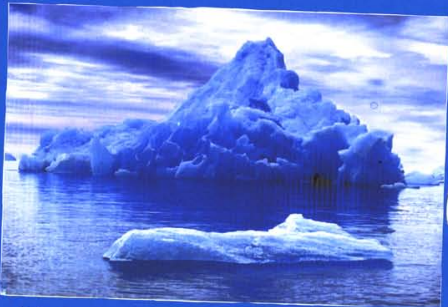
Nas regiões polares, a maior parte da água está no estado sólido.

Vista do espaço, a Terra é um planeta azul porque cerca de 71% da sua superfície está coberta por água. Na Terra, a água encontra-se nos três estados da natureza: sólido, líquido e gasoso.