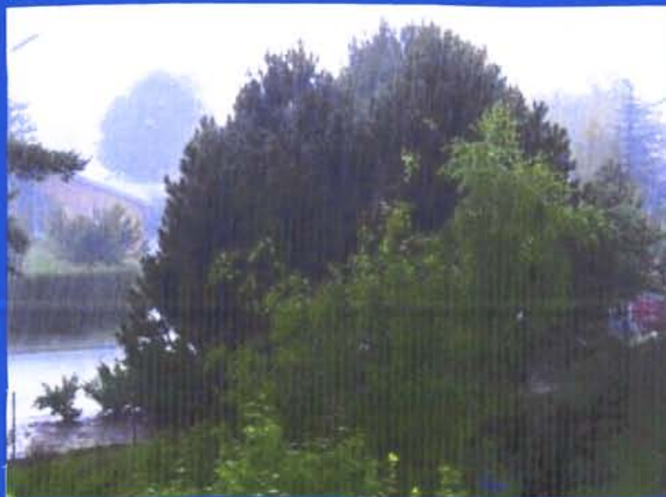
A água que passa da atmosfera para o solo - chuva